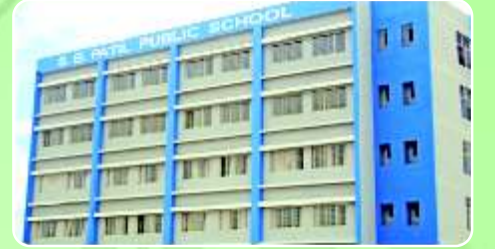
S. B. Patil Public School ( www.sbpatilschool.com )