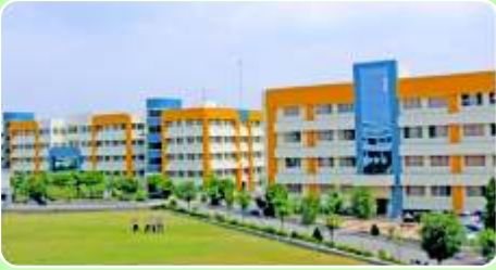
Pimpri Chinchwad College of Engineering ( www.pccoepune.com )