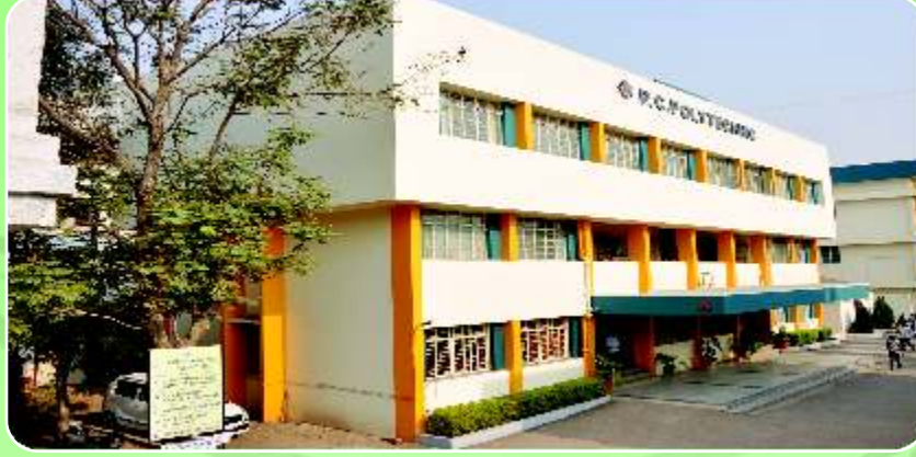
Pimpri Chinchwad Polytechnic ( www.pcpolytechnic.com )