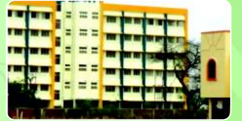
S. B. Patil College of Science & Commerce ( www.sbpatilcollege.com )