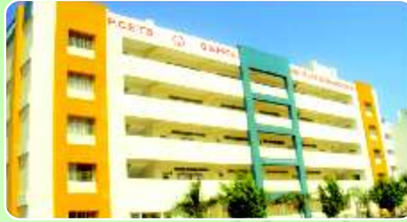
S. B. Patil Institute of Management ( www.sbpatilmba.com )