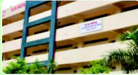
S. B. Patil College of Architecture & Design ( www.sbpatilarchitecture.com )