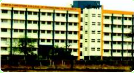
Pimpri Chinchwad College of Engineering & Research ( www.pccoer.com )