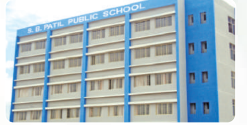
S. B. Patil Public School ( www.sbpatilschool.com )