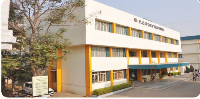
Pimpri Chinchwad Polytechnic ( www.pcpolytechnic.com )