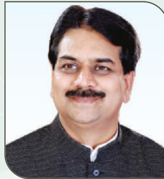
मा. श्री. हर्षवर्धनजी पाटील मा. सहकार व संसदीय कार्य मंत्री (महाराष्ट्र राज्य) विश्वस्त - पिं. चिं. एज्यु. ट्रस्ट