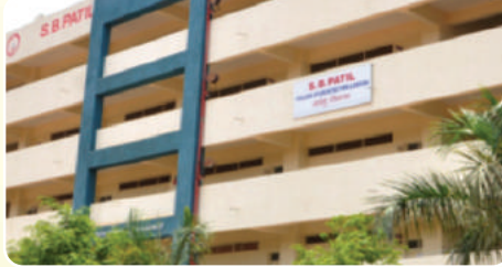
S. B. Patil College of Architecture & Design ( www.sbpatilarchitecture.com )