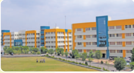
Pimpri Chinchwad College of Engineering ( www.pccoepune.com )