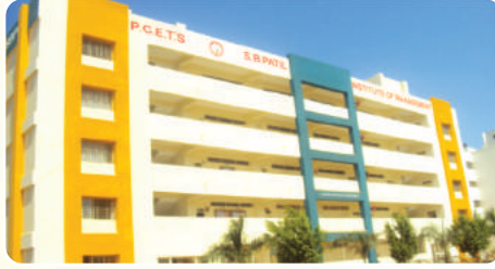
S. B. Patil Institute of Management ( www.sbpatilmba.com )