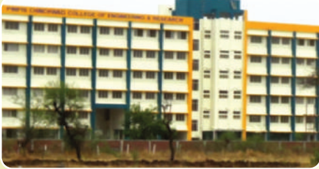
Pimpri Chinchwad College of Engineering & Research ( www.pccoer.com )