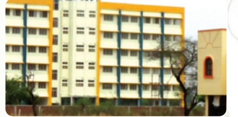
S. B. Patil College of Science & Commerce ( www.sbpatilcollege.com )