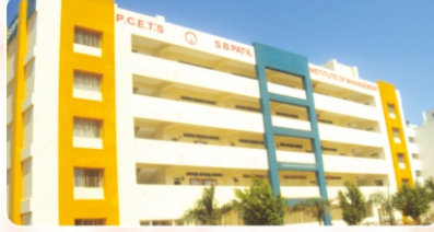
S. B. Patil Institute of Management ( www.sbpatilmba.com )