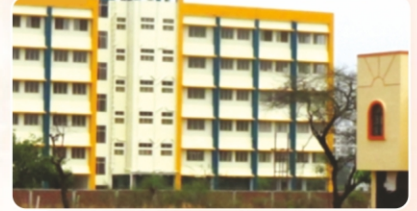
S. B. Patil College of Science & Commerce ( www.sbpatilcollege.com )