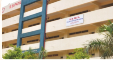
S. B. Patil College of Architecture & Design ( www.sbpatilarchitecture.com )