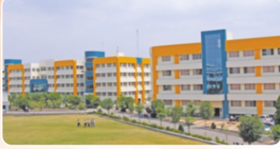
Pimpri Chinchwad College of Engineering ( www.pccoepune.com )