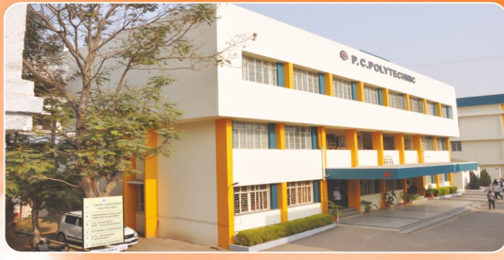
Pimpri Chinchwad Polytechnic ( www.pcpolytechnic.com )