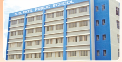
S. B. Patil Public School ( www.sbpatilschool.com )