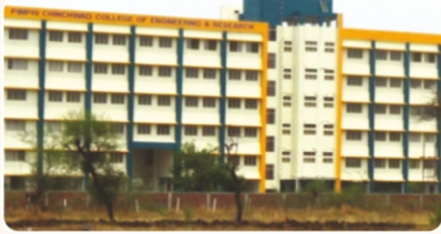
Pimpri Chinchwad College of Engineering & Research ( www.pccoer.com )