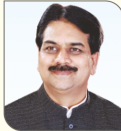
मा. श्री. हर्षवर्धनजी पाटील मा. सहकार व संसदीय कार्य मंत्री (महाराष्ट्र राज्य) विश्वस्त - पि. चि. एज्यु. ट्रस्ट